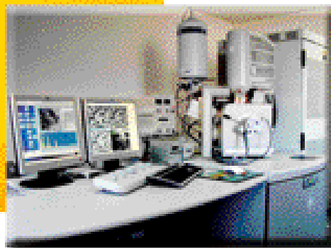
MEB environnemental haute résolution