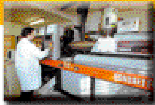
Presse à injecter