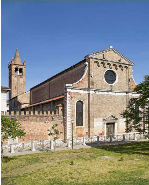
Eglise de Santa Maria Maggiore, à Venise ; les tests sur les piliers devront permettre de les restaurer afin d'éviter l'effondrement de l'église.