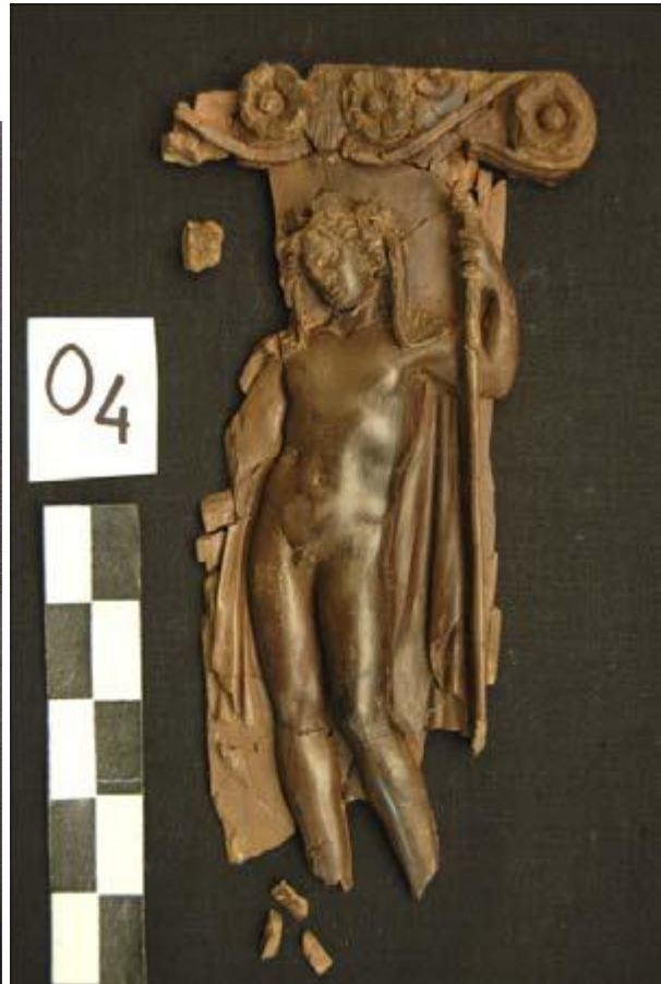
Détails des décorations du trône d'Herculanum ; il s'agit de décoration en ivoire, mais noircies par le temps. La structure du meuble est en bois.