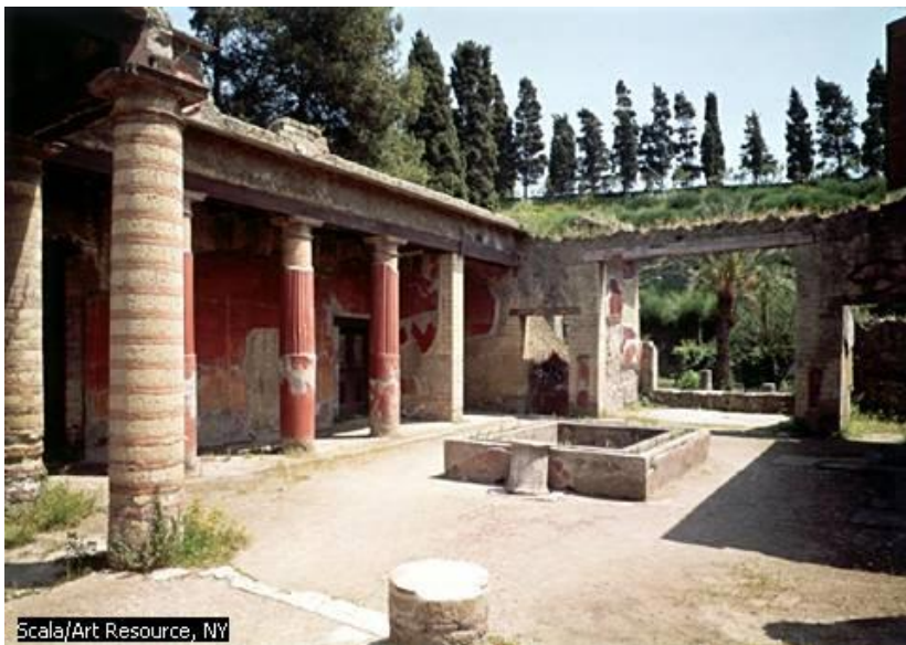
Vue générale de la Maison du Relief de Télèphe, à Herculaneum ; le toit et donc le plafond a été retrouvé à côté de la maison, probablement arraché lors de l'éruption.