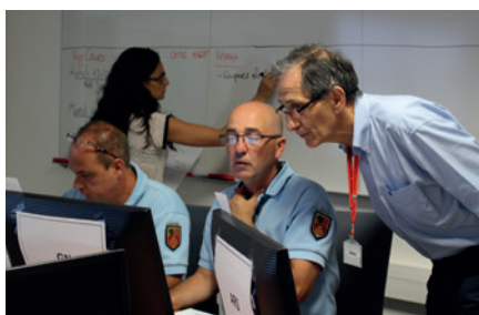
Le COD de la Préfecture du Gard dans le simulateur