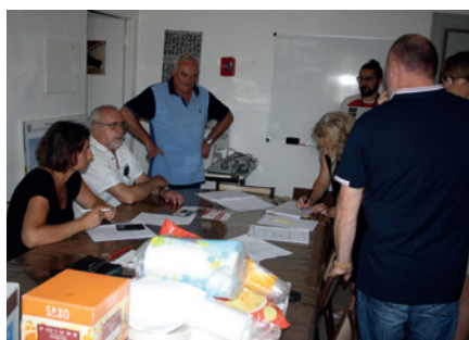
Cellule de crise communale Saint-Chaptes