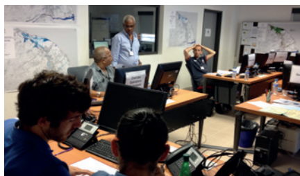
Cellule de crise communale Sainte-Suzanne dans le simulateur