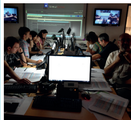
Simulation de gestion de crise